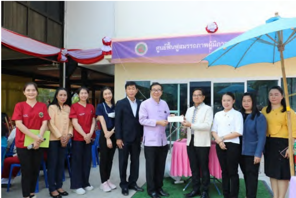
ภาพที่ 3 การเปิดศูนย์ฟื้นฟูสมรรถภาพผู้มีภาวะพึ่งพิง อต.ร้องวัวแดง