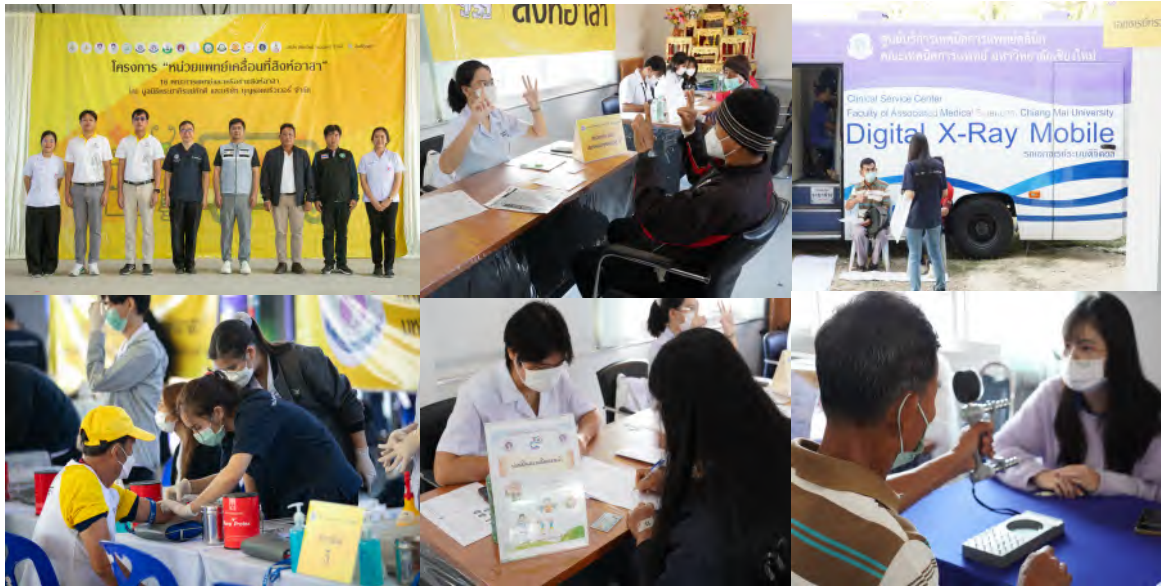
ภาพที่ 5 การออกหน่วยบริการตรวจสุขภาพให้กับประชาชนร่วมกับโครงการสิงห์อาสา