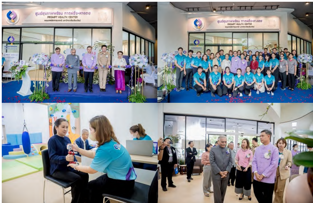
ภาพที่ 2 พิธีเปิดศูนย์สุขภาพพร้อม สาขาภาคฝรั่ง-หางดง

บริหารส่วนตำบลดอยหล่อ อ. ดอยหล่อ จ. เชียงใหม่ ซึ่งเป็นแหล่งที่มีผู้พิการที่มีภาวะพึ่งพิงจำนวนมาก ได้ร่วมกันวางแผนจัดตั้ง “ศูนย์ฟื้นฟูสมรรถภาพผู้ที่มีภาวะพึ่งพิงองค์การบริหารส่วนตำบลดอยหล่อ” ซึ่งเปิดดำเนินการในปีงบประมาณ 2563 โดยมีเป้าหมายเพื่อเป็นศูนย์สร้างเสริมสุขภาพ และการบำบัดฟื้นฟูแก่ประชากร ผู้พิการติดบ้าน ติดเตียง ผู้สูงอายุในเขตพื้นที่ให้มีคุณภาพชีวิตที่ดีขึ้น สามารถช่วยเหลือตนเองได้มากขึ้น โดยไม่เป็นภาระแก่ครอบครัวและสังคม หรือเป็นภาระน้อยที่สุด และมุ่งหวังให้เป็นต้นแบบของศูนย์ฟื้นฟูสมรรถภาพในชุมชนระดับองค์การบริหารส่วนตำบลให้แก่องค์การปกครองส่วนท้องถิ่นอื่น ๆ โดยได้ขยายผลไปยังองค์การบริหารส่วนตำบลแม่ก๊า อ.สันป่าตอง จ.เชียงใหม่ ในปีงบประมาณ 2564 และมีการดำเนินการอย่างต่อเนื่อง ซึ่งคณะฯ ได้ถอดบทเรียนในการบริหารจัดการศูนย์ฟื้นฟูฯ ทั้ง 2 แห่ง เพื่อนำมาขยายผลในการดำเนินการร่วมกับชุมชนที่มีความต้องการดูแลผู้สูงอายุและผู้พิการในพื้นที่ โดยในปีงบประมาณ 2566 คณะฯ ได้ร่วมกับ องค์การบริหารส่วนตำบลร้องวัวแดง อ.สันกำแพง จ.เชียงใหม่ ในการจัดตั้งศูนย์ฟื้นฟูฯ (ภาพที่ 3) และสนับสนุนเครื่องมือและอุปกรณ์บางส่วนรวมถึงการให้ความรู้และคำปรึกษากับศูนย์ฟื้นฟูสมรรถภาพผู้สูงอายุและผู้พิการ เทศบาลตำบลแม่วาง อ.แม่วาง จ.เชียงใหม่ ในการดูแลผู้สูงอายุและผู้พิการในพื้นที่ (ภาพที่ 4) โดยจนถึงปัจจุบันมีผู้สูงอายุ ผู้พิการ และผู้ที่มีภาวะพึ่งพิงเข้ารับบริการในศูนย์ต่าง ๆ รายละเอียดตามตารางที่ 5