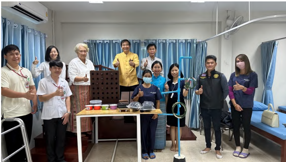
ภาพที่ 4 การสนับสนุนอุปกรณ์สำหรับใช้ในศูนย์ฟื้นฟูสมรรถภาพผู้สูงอายุและผู้พิการ ทต.แม่วาง