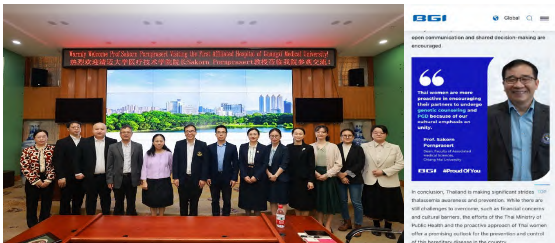
ภาพที่ 1 การส่งเสริมความร่วมมือด้านการวิจัยกับบริษัทเอกชนและสถาบันการศึกษาในต่างประเทศ

เพื่อสนับสนุนงานวิจัยด้านการแพทย์แม่นยำ คณะฯ มีความร่วมมือกับ The First Affiliated Hospital of Guangxi Medical University และ BGI Genomics บริษัทโซลูชันทางการแพทย์ชั้นนำระดับโลก เพื่อแลกเปลี่ยนนักศึกษาและบุคลากร ทำงานวิจัยร่วมกัน และถ่ายทอดเทคโนโลยีด้านการตรวจวินิจฉัยและป้องกันโรคธาลัสซีเมีย (ภาพที่ 1)